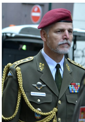
arm. gen. Ing. Petr Pavel, M.A. (nar. 1961)

Vojenské a zahraničně politické aspekty aktuálních hrozeb